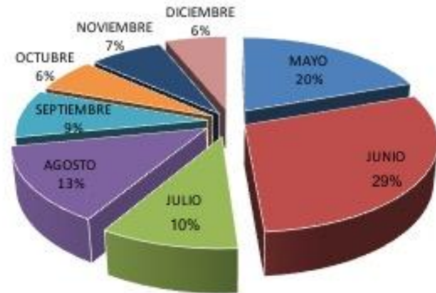
EXONERACIONES POR TERCERA EDAD Y DISCAPACIDAD

■ MAYO ■ JUNIO ■ JULIO ■ AGOSTO ■ SEPTIEMBRE ■ OCTUBRE ■ NOVIEMBRE ■ DICIEMBRE